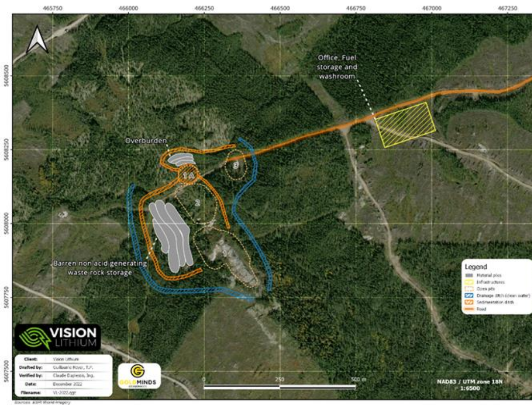
Figure 1: Aspect général du site

Le transport de la roche minéralisée du site minier à Chibougamau sera effectué par un entrepreneur. Les chemins forestiers reliant la propriété à la voie ferrée à Chibougamau peuvent accueillir des camions lourds jusqu'à 150 tonnes.